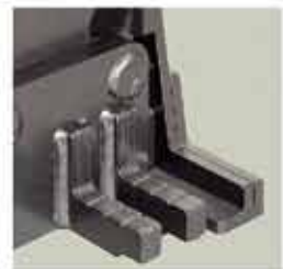
Uña de elevación extra baja (25 mm)

MGL-10 es la combinación de la estructura de elevación BL-10 y el gato MG-10 (también puede utilizarse el gato MG-8.)